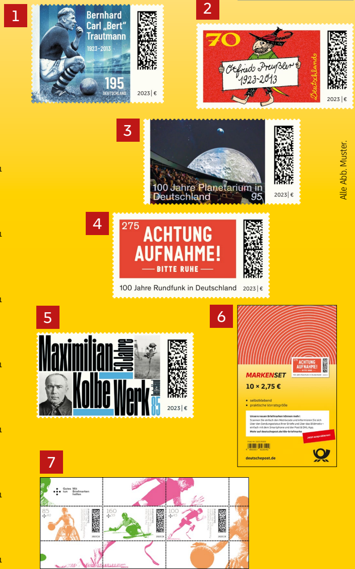
Alle Abb. Muster.