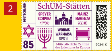
Alle Abb. Muster.